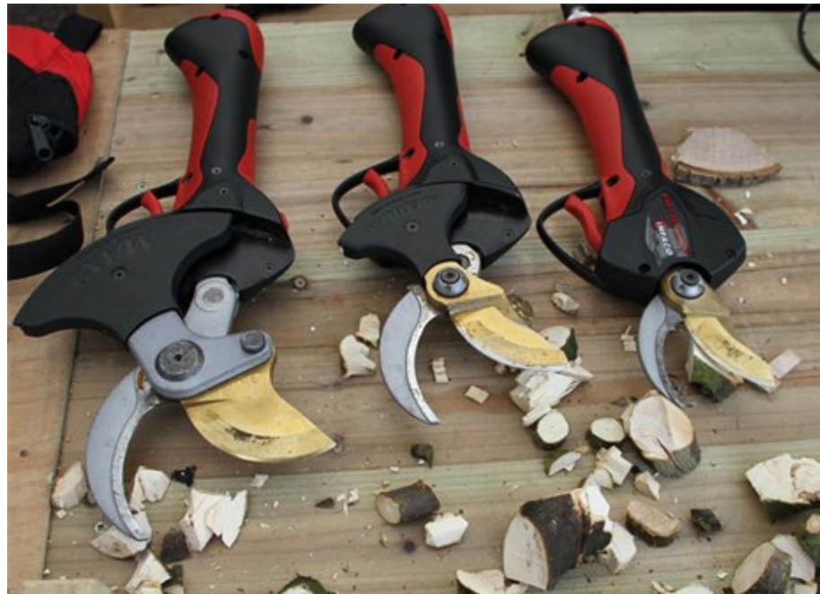
Das Sicherheitssystem für Electrocoup Astscheren, deren unterschiedlich große Schneidköpfe sich austauschen lassen, erhielt die begehrte GaLaBau Innovationsmedaille 2014.

AUGSBURG, 14.11.2014 - Mit einer Innovationsmedaille wurde das Sicherheitssystem DSES für Akku-Astscheren der Marke Electrocoup auf der GaLaBau Fachmesse im September ausgezeichnet. Die Redaktion bi-GaLaBau ließ sich das Sicherheitssystem bereits vorher auf den Deutschen Baumpflegetagen in Augsburg erläutern.